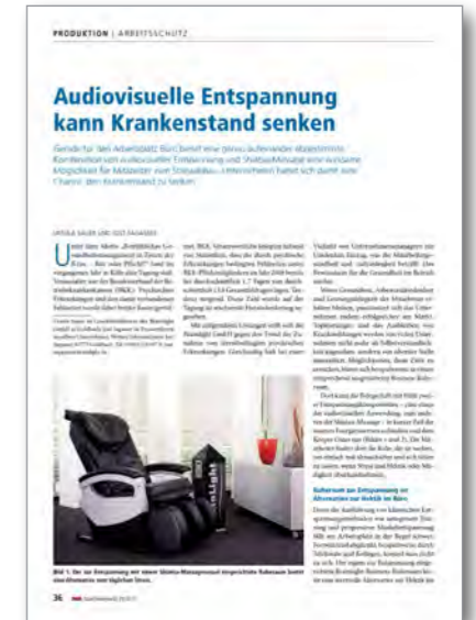
Audiovisuelle Entspannung kann Krankenstand senken MM Maschinenmarkt