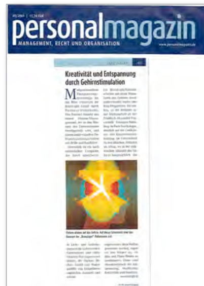
Kreativität und Entspannung Personalmagazin