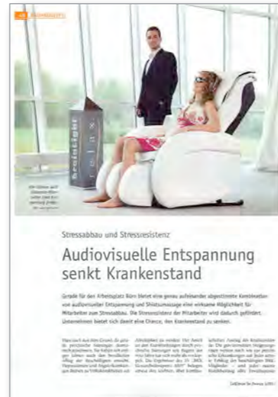
Business-Ruheräumen CallCenter for Finance