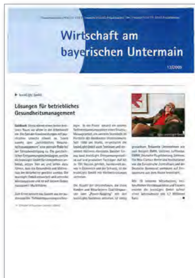
Förderung von brainLight in Unternehmen Wirtschaft am bayerischen Untermain