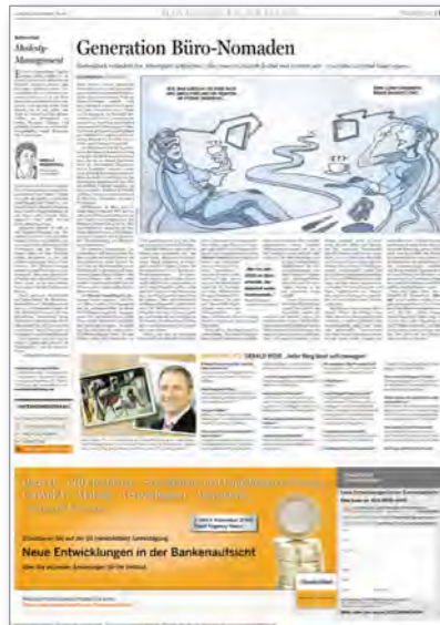
Büro der Zukunft Handelsblatt