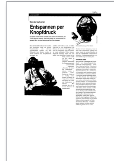
Wenn der Kopf voll ist Wirtschaft in Mainfranken